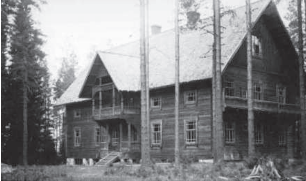
Elämänmäen parantolarakennus, jonka Vilppulan kunta osti toiminnan loputtua ja se siirrettiin 1920-luvun lopulla Ajosjärven rantaan maamieskoulun käyttöön.