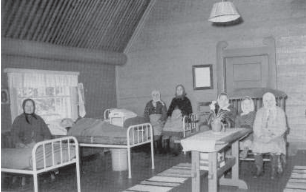
Katajamäen naistenosaston hoidokkeja.

Vuonna 1920 Katajamäkeen siirrettiin myös mielisairaita. Tämän ratkaisun piti olla väliaikainen, mutta tilanne vakiintui, kun paikalle perustettiin mielisairasosasto, joka kulki kansansuussa "Hourulana".