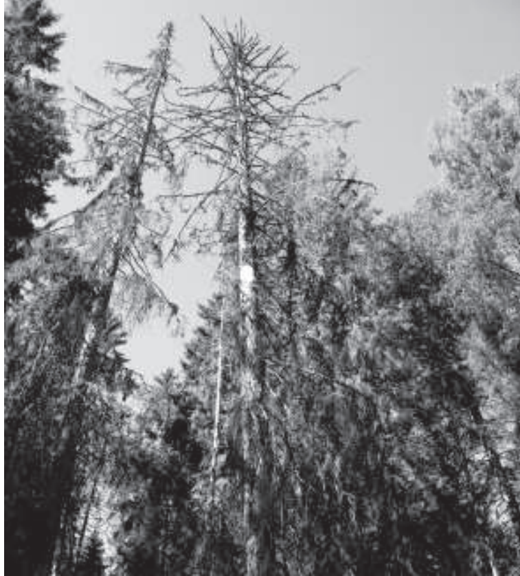
Pahoin harsuuntuneita Elämänmäen kuusia.

Suojelualue on yhteydessä varttuneisiin, talouskäytössä oleviin metsiin etelä- ja koillispuolilta. Itäosa rajoittuu jyrkästi hakkuuaukeaan, ja pohjoisrajan muodostaa Elänten järvi.