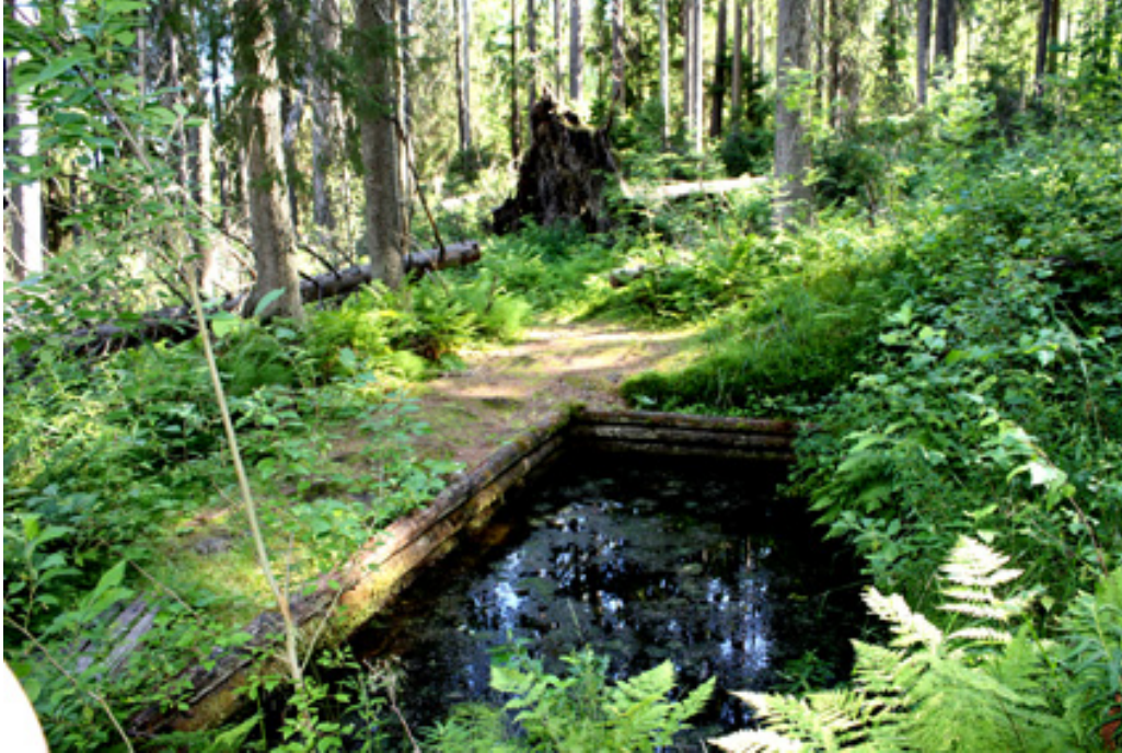
Elämänmäen hoitamatta jätetty lähde; taustalla näkyy tuulikaatoja, joita ei enää korjata pois. Ne lisäävät luonnon monimuotoisuutta.

puut juurineen ja vahinko muodostuu kasvutappioina ja kalliimpana korjuuna.