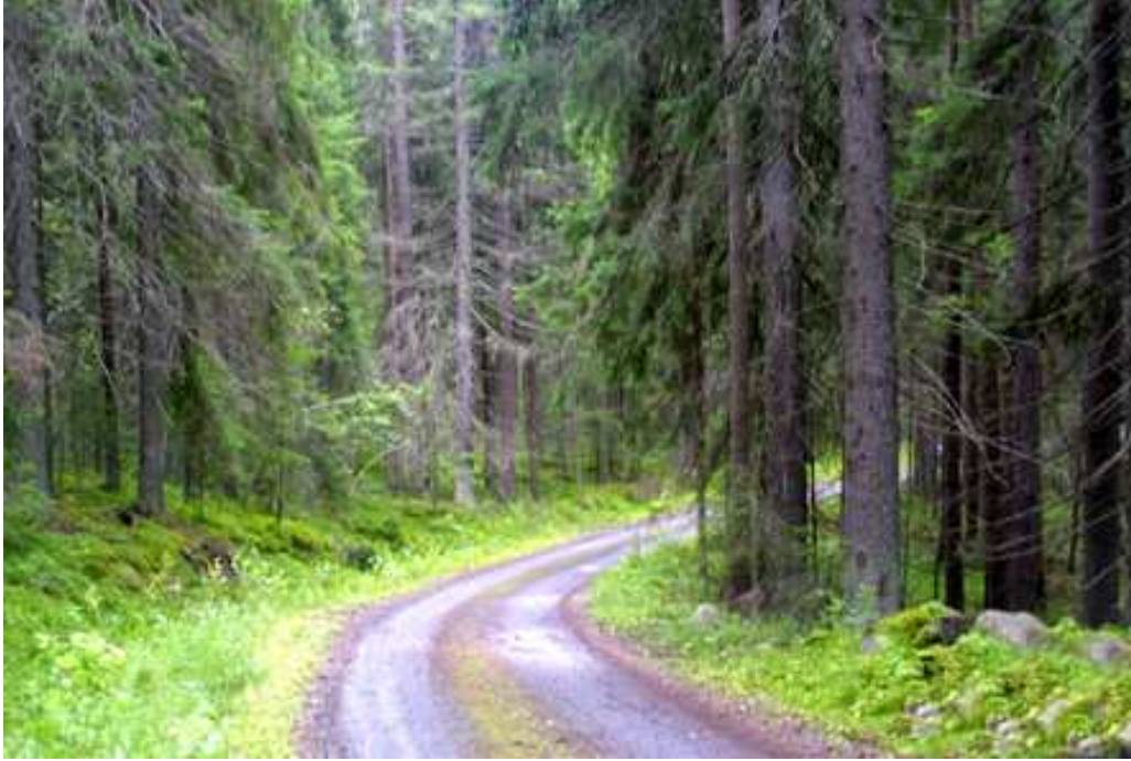
Sankkaa kuusimetsää Elämänmäen rinteillä. Kuva I-MK-V