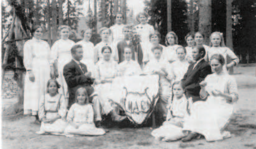
Nimipäivän viettoa Elämänmäessä.

Elämänmäen parantolalla oli hyvin suuri merkitys ympäröivien kylien kehitykselle. Elämänmäki tarjosi työtä, osti elintarvikkeita ja antoi sivistystäkin siinä sivussa.