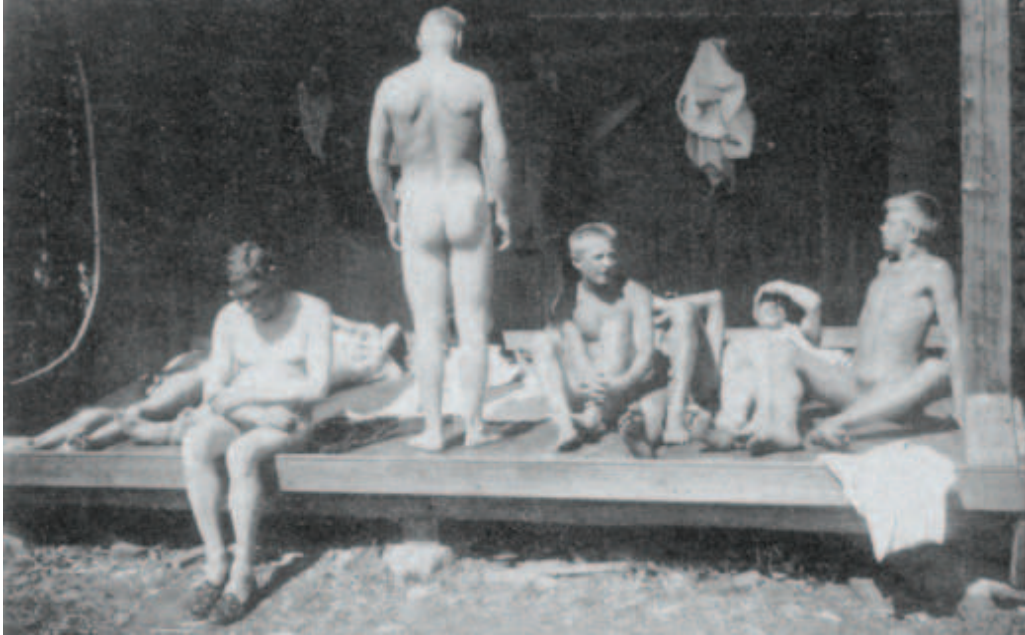
Lybeckin potilaat aurinkokylpyjä ottamassa.