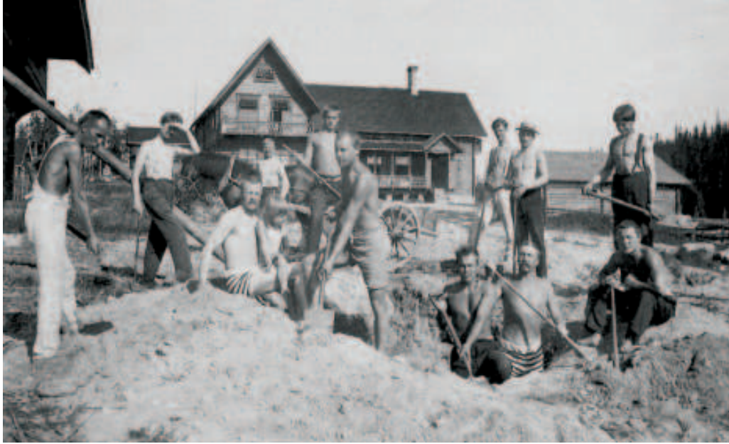
Hoitomuoto tämäkin - raskas ruumillinen työ.

Taalu, joka on Jukolassa ja julisteena Elämänmäessä, paikallistaa linnunpesän.