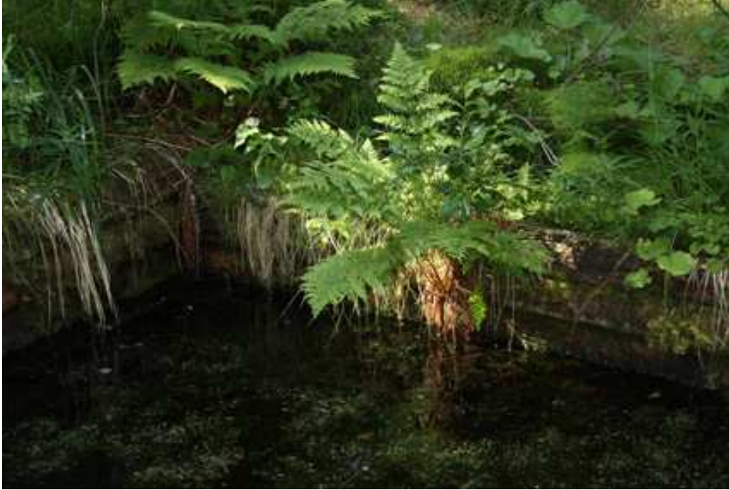
Elämänmäen lähde, kuvannut Raija Janhonen.