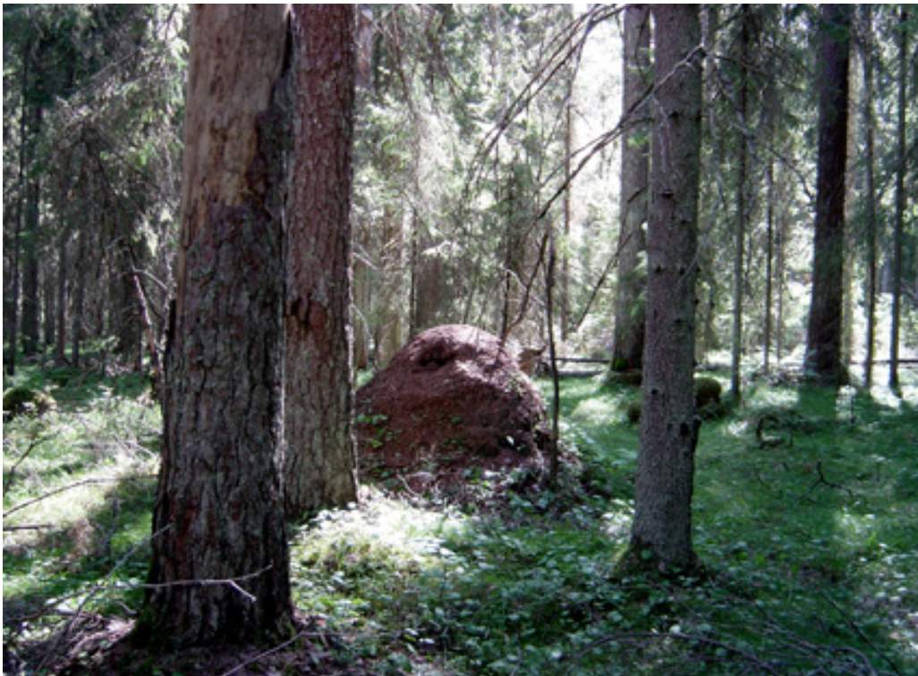
Komea muurahaispesä Elämänmäellä.