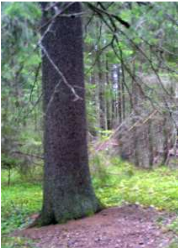
Komea kuusenrunko Elämänmäen huipulla. Kuva I-MK-V