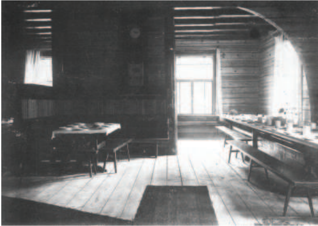
Elämänmäen pirtti.